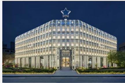
Dior Seongsu (D.P.J & Partners, 2022)

Les entreprises étrangères souhaitant opérer en Corée doivent impérativement répondre à appels à projets, souvent disponibles uniquement en coréen, et s'associer à un partenaire local (entreprise coréenne). Cette approche souligne l'importance de l'adaptation aux pratiques commerciales et réglementaires locales pour réussir.