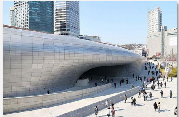
Le Dongdaemun Design Plaza (architecte : Zaha Hadid)