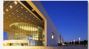
Le Musée national de Corée