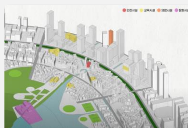
Projet « Smart City »

Le développement des villes intelligentes, les problématiques liées au développement durable (notamment les normes environnementales) et au design d'espace urbain adapté aux enjeux climatiques et écologiques sont des enjeux forts pour la Corée du Sud, et représentent des opportunités à saisir. Exemple notable, la mise en place d'abribus intelligents à Séoul, capables d'aider à lutter contre la propagation d'épidémies ou de purifier l'air grâce à leur végétalisation. On note aussi une appétence naissante pour l'éco-conception, allant du design d'objet de consommation jusqu'aux éco-quartiers.