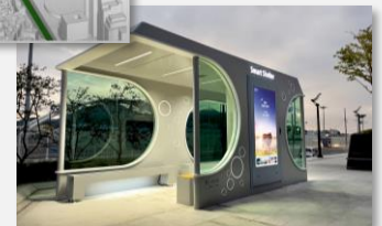
Projet d'abribus « Smart Shelter »