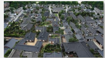
Village hanok de Jeonju

Le design coréen est quant à lui connu pour son style minimaliste, sa simplicité et son élégance.