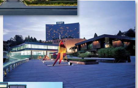
Leeum Musée d'Art Contemporain (Jean Nouvel, 2004)