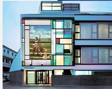
Musée Daelim (Vincent Cornu, 2002)