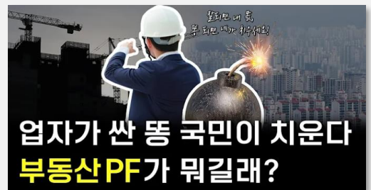
Les PF, une bombe à retardement ?

Le secteur de la construction est à un tournant crucial, confronté à l'effondrement financier de la société de construction Taeyoung Engineering & Construction, résultant d'un endettement en hausse et d'un marché immobilier en déclin. La société, dépendante des prêts de financement de projets immobiliers (PF) pour son développement, et fragilisée par un marché en contraction, s'est retrouvée incapable de tenir ses engagements financiers en dépit des négociations avec ses créanciers. Cette crise qui a éclaté en mai 2024 a été interprétée comme un miroir des défis structurels de l'industrie. Les emprunts accordés pour le financement de projets immobiliers, basés sur des anticipations de valeur, exacerbent le risque de non-paiement face à l'incertitude du marché. L'ère actuelle, caractérisée par un accroissement des taux d'intérêt, des bouleversements dus à la crise sanitaire et une demande en baisse, renforce les contraintes financières sur les acteurs de la construction. L'éventualité d'une propagation de la crise à d'autres entreprises plus fragiles commande la mise en place de stratégies proactives afin de consolider la stabilité de ce secteur.