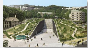
L'université féminine d'Ewha