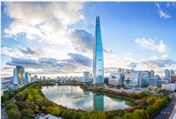
La Lotte Tower (architecte : James Von Klemperer)

Flagship de l'architecture mondiale et fierté des séoulites, la Lotte Tower et ses 555 mètres, 6 e plus grande tour au monde a par exemple été conçue par James Von Klemperer, architecte américain. Le design urbain est un marché qui recèle également de nombreuses opportunités, la ville de Séoul ayant été désignée en 2010 capitale mondiale du design par l' International Council of Societies of Industrial Design . Des lieux hautement symboliques tels que le DDP (Dongdaemun Design Plaza, lieu d'expositions et de salons conçu par Zaha Hadid) font état du dynamisme de ce secteur en Corée.