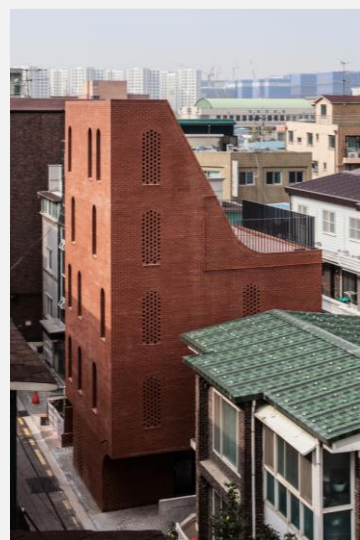
La Five-story House à Séoul

Mais cette tendance permet également de renouveler les standards architecturaux et laisser place à une réflexion sur de nouveaux modèles. La Five-Story House construite à Gangseo-Gu (quartier résidentiel de Séoul) en est un exemple et explore les relations entre le logement familial et un contexte urbain dense. Elle propose une solution de logements à mi-chemin entre les complexes d'appartements de grande hauteur et les résidences individuelles. Autre exemple de l'évolution de l'architecture à Séoul, le développement de nombreux appartements de taille très réduite, proposant tout le confort nécessaire à la vie moderne grâce à un design innovant. Ces petites surfaces sont de plus en plus recherchées. Le marché de l'architecture sud-coréenne, particulièrement séoulite, est ainsi en renouvellement constant et offre de belles opportunités pour les architectes et designers étrangers.