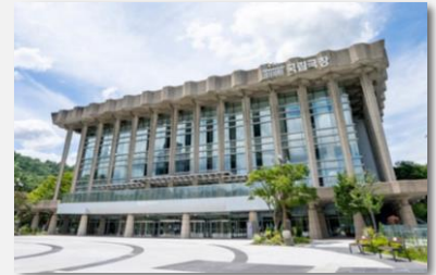
Le Théâtre National de Corée

Depuis quelques années, un changement de paradigme a lieu avec un retour à la tradition et une plus grande affirmation du patrimoine national, notamment par sa remise au goût du jour grâce à des artistes travaillant à le moderniser. La scène internationale reste cependant également bien représentée.