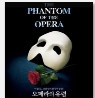
Le Fantôme de l'Opéra, premier grand succès pour une comédie musicale en Corée du Sud