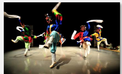
Le Talchum, pratique théâtrale traditionnelle en Corée du Sud

Très fortement ancré dans la culture locale, le théâtre traditionnel est aujourd'hui toujours très réputé en Corée. Il est d'ailleurs soutenu par le gouvernement qui le finance et aide sa promotion. L'État intervient aussi pour financer le théâtre contemporain via le Théâtre National ou le Seoul Performing Arts Center. Le répertoire principal se compose de pièces classiques de Shakespeare ou de Tchekhov, en version traditionnelle coréenne. Dans le quartier de Daehak-ro de Séoul se développe le théâtre indépendant coréen. Parfois surnommé le « off-Broadway », il propose de nombreuses pièces contemporaines et expérimentales. Enfin, le théâtre populaire est également en développement. Il est joué dans des espaces construits par de grands groupes privés. Les pièces montées sont des pièces et comédies musicales très populaires, parfois des remakes coréens de grand succès internationaux de la scène européenne ou américaine.