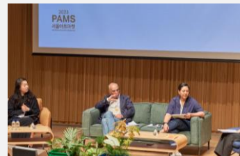
L'édition 2023 du PAMS à Séoul

Salon international pour les professionnels des arts du spectacle, organisé chaque année en octobre par le Korea Arts Management Service. Les principaux objectifs du PAMS sont de dynamiser la distribution et l'exportation des spectacles coréens. Les performances, stands promouvant les troupes et leurs œuvres, sessions d'information et programmes de mise en réseau permettent aux professionnels internationaux de partager les dernières tendances et données clés concernant les arts du spectacle dans le monde.