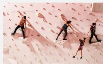
L'édition 2023 du SPAF à Séoul

Festival d'arts du spectacle contemporain. Il présente des œuvres d'artistes coréens et internationaux dans tous les genres (théâtre, danse et arts pluridisciplinaires) et accueille des artistes venus du monde entier. Il suscite un grand intérêt de la part des spectateurs et des médias, et est reconnu par les artistes comme un événement qui façonne et définit les tendances en matière d'arts du spectacle contemporain.