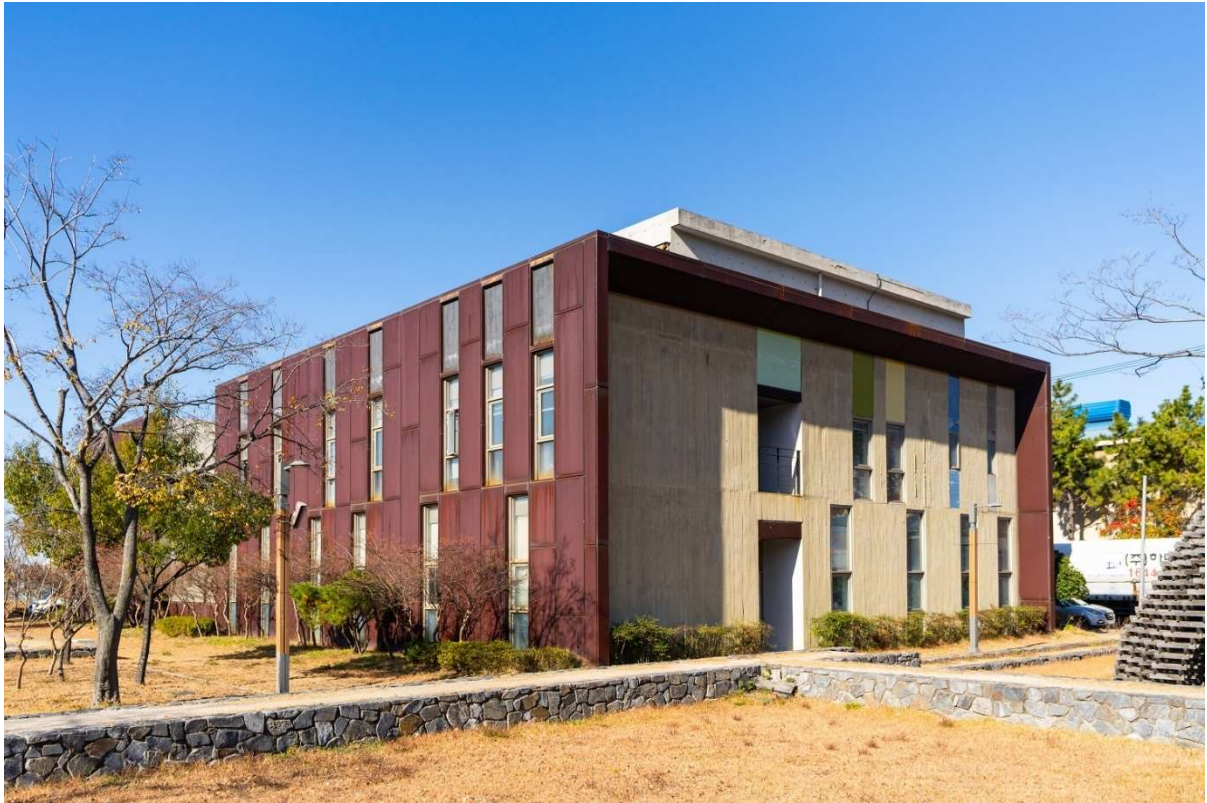
© Hongti Art Center / Extérieur du Hongti Art Center