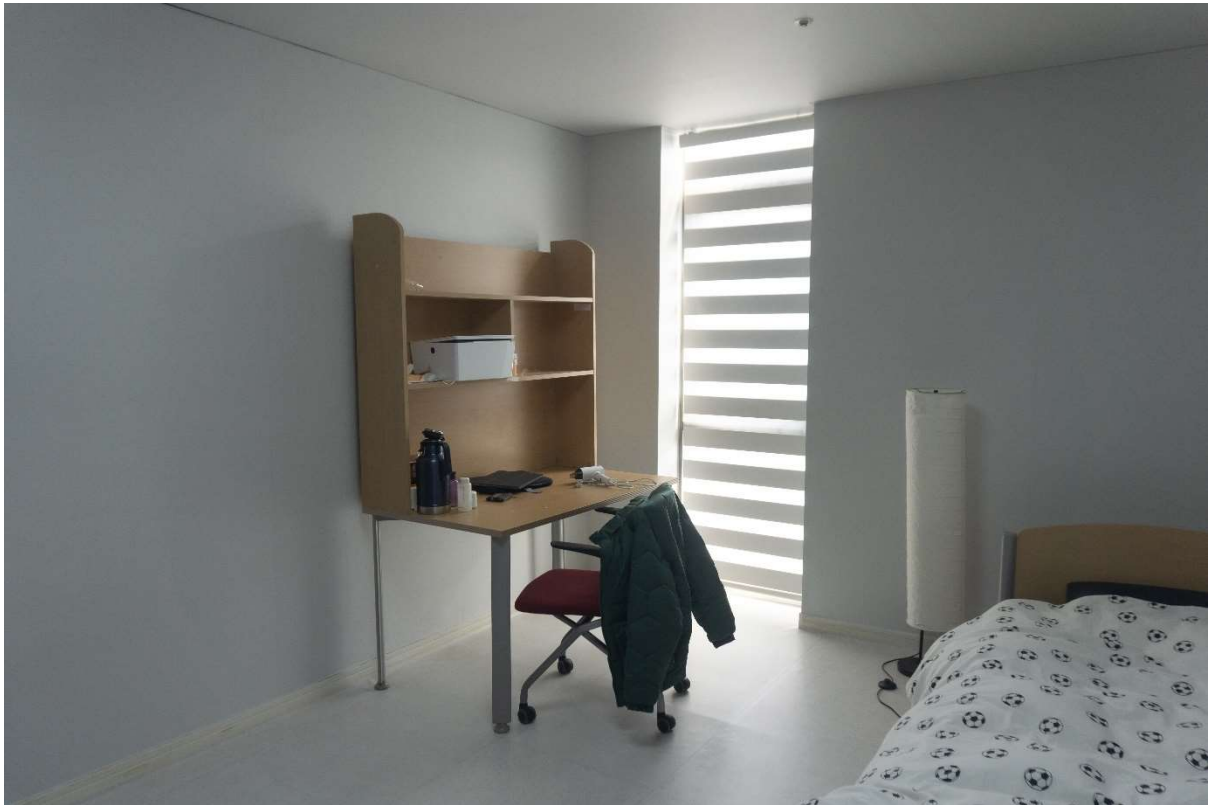
© Hongti Art Center / Chambre