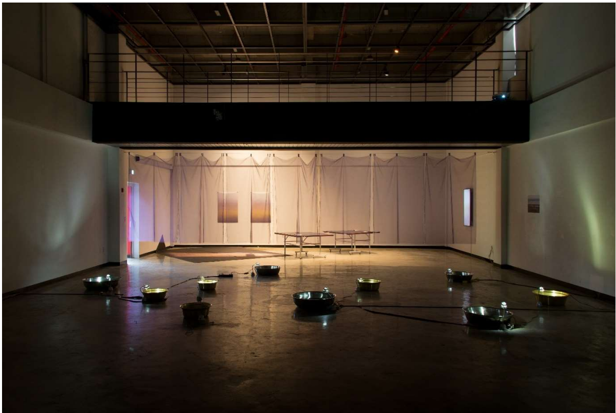
© Hongti Art Center / Espace d'exposition