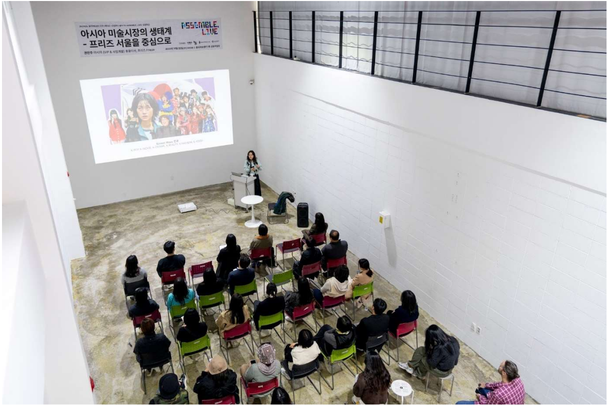
© Hongti Art Center / Espace polyvalent