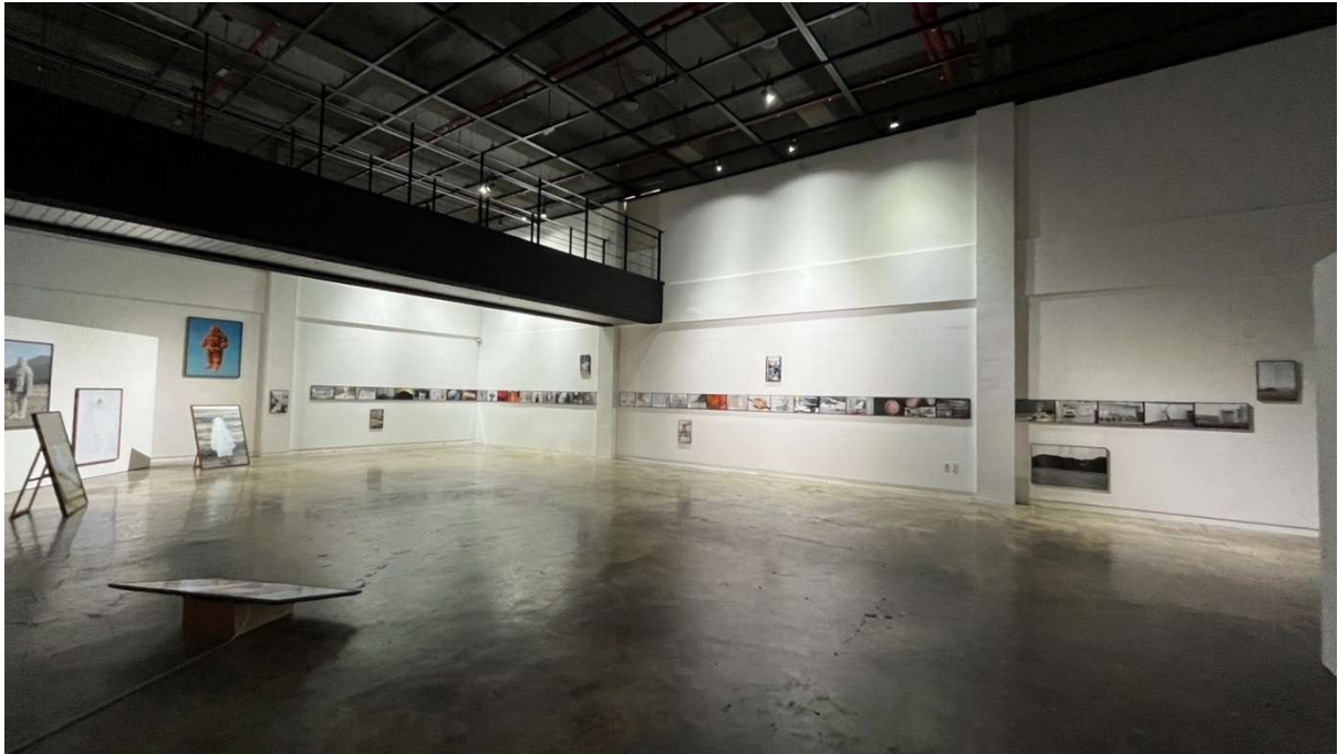
© Hongti Art Center / Espace d'exposition